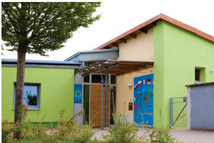
Kindertagesstätte „Dr.-Jacob-Goldmann“ Willy-Brandt-Str. 5-7, Reinheim Tel. 914 760