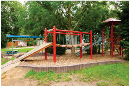
Kindertagesstätte „Am Stadtpark“ Cestasplatz 2, Reinheim Tel. 840 94