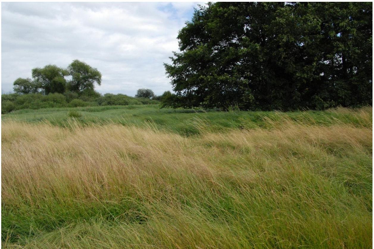
Foto 3 Seggenried und Frischwiese nördlich des zentralen Bereichs