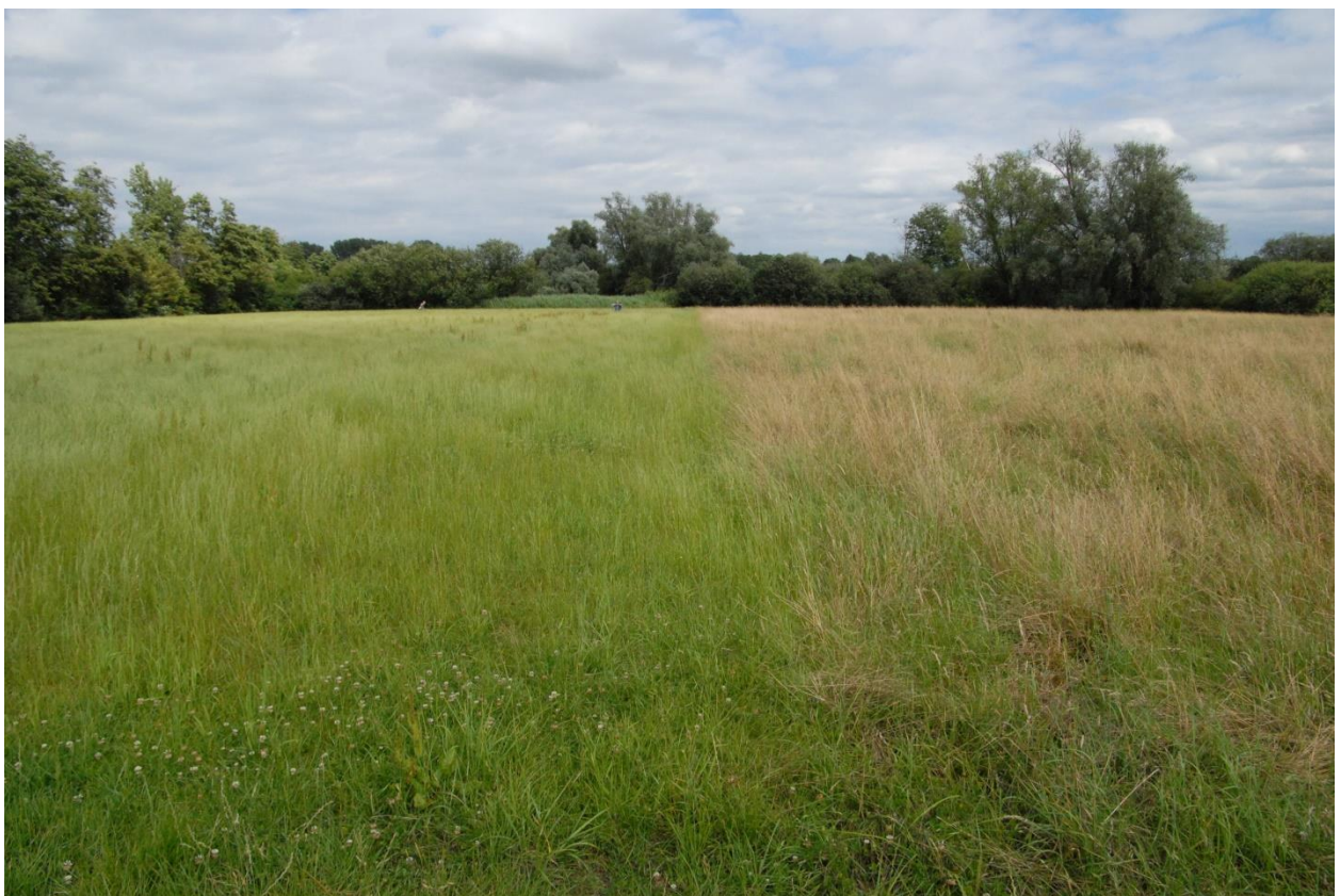
Foto 5 Lolium-Einsaat am Nordrand des Untersuchungsgebietes