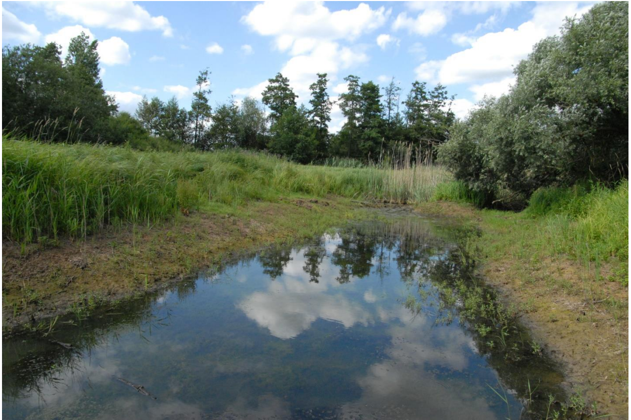
Foto 4 Tümpel im Norden des Untersuchungsbereichs