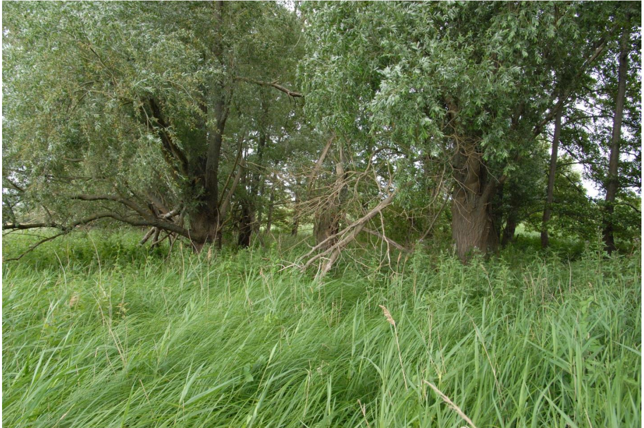
Foto 2 Weidengehölz