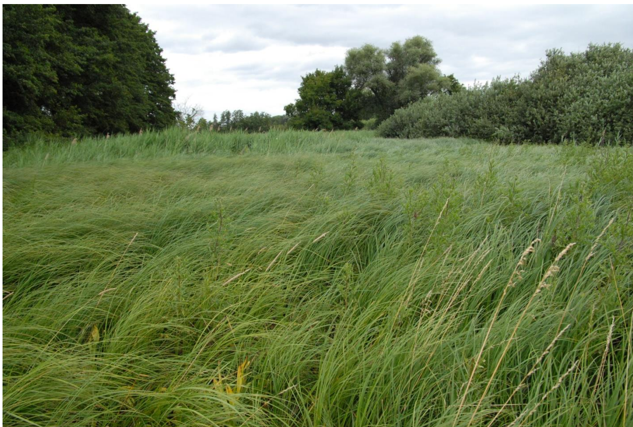
Foto 1 Segenried, Röhricht, Weidengebüsch und sonstige Gehölze der Auen im zentralen Teil des Untersuchungsbereichs

Durch eine extensive Beweidung können von diesen Biotoptypen das recht einförmige und artenarme Schilfröhricht und eventuell die Kleingewässer aufgewertet werden. Die anderen Biotoptypen im zentralen Bereich sollten nicht oder nur kleinflächig in die Beweidung einbezogen werden.